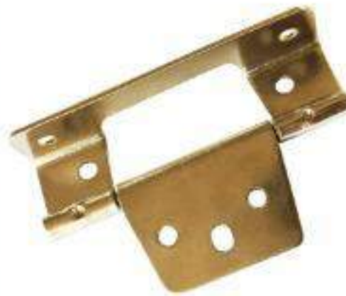
PIEZA BISAGRA TIPO "L" CHICA