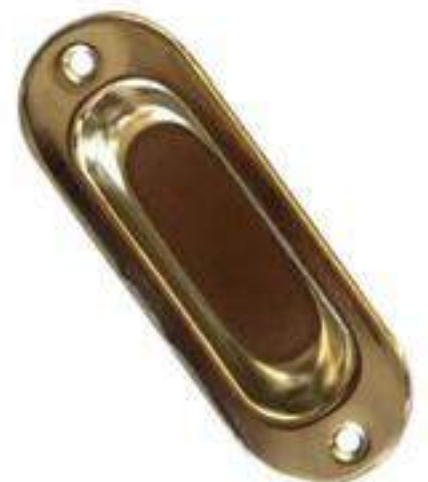
LAMINA LATONADA Y LAMINA NIQUELADA