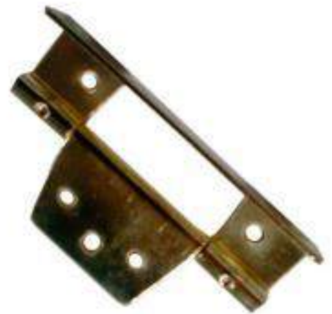
PIEZA BISAGRA TIPO "L" GRANDE