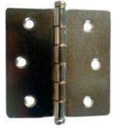
PIEZA BISAGRA 3x3 PERNO