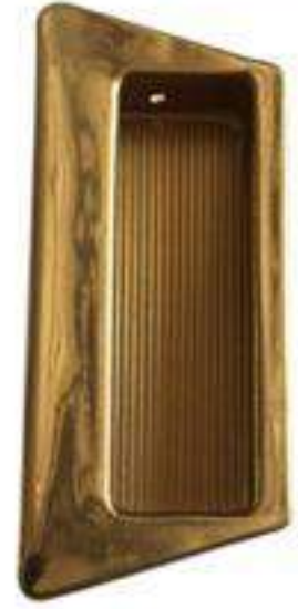
Nº 22 PICOS LATÓN PULIDO