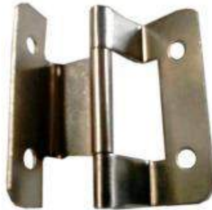
PIEZA BISAGRA TIPO "T"