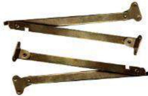
PIEZA SOPORTE P/CONSOLA