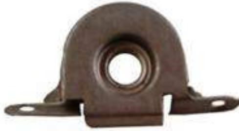
PIEZA MODELO No. 181