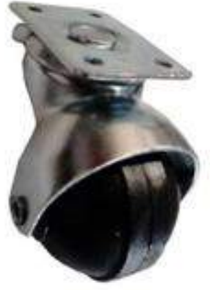
JUEGO RODAJAS MALETERA