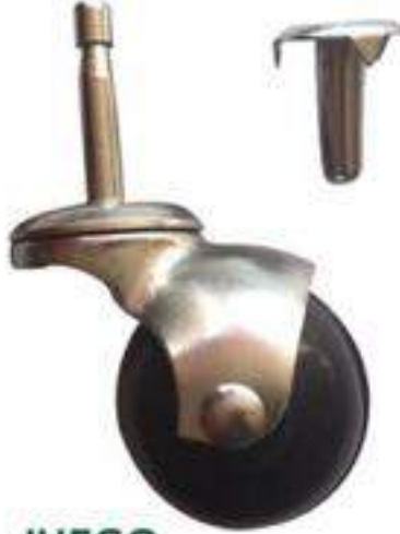
JUEGO ESPIGA 2"