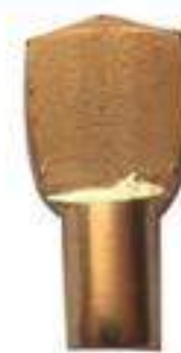
PIEZA MÉNSULA DE PALETA