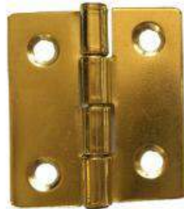
PIEZA BISAGRA DE LIBRO 1" 1/2