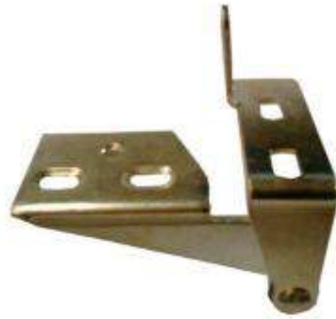
JUEGO BIS. SENCILLA P/ COCINA