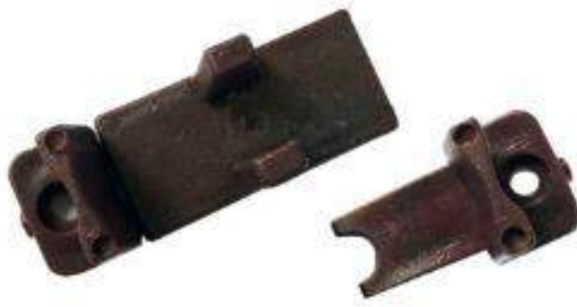
PIEZA GUÍA DOBLE P/CLOSET