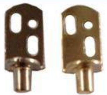
PIEZA MÉNSULA DE PERNO