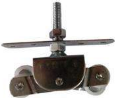
JUEGO 4 BALEROS NYLON