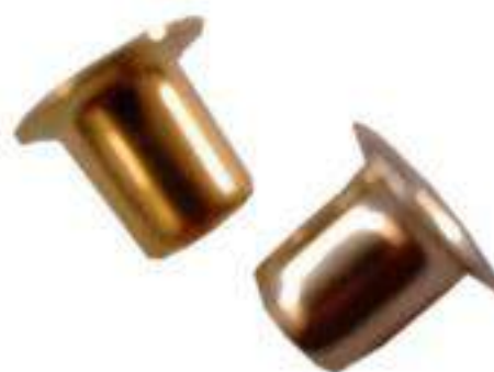
OJILLO P/MÉNSULA DE 1/4" LATÓN NIQUEL