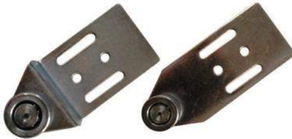
PIEZA CURVA Y PLANA