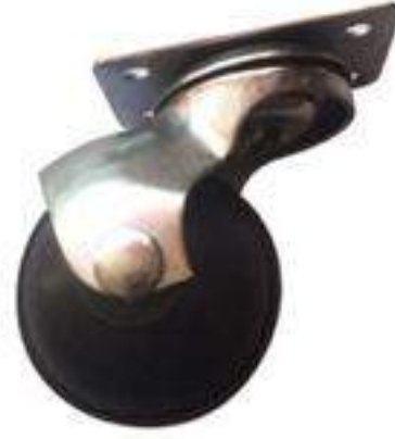
JUEGO PLACA 1 5/8"