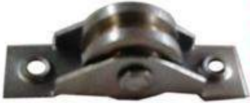
PIEZA MODELO No. 36