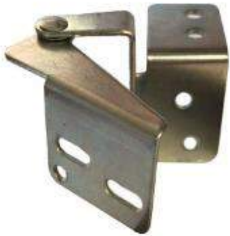
JUEGO BISAGRA BIBEL P/COCINA