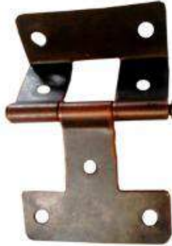
PIEZA BISAGRA TIPO "T"