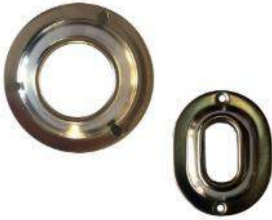
JUEGO BRIDA P/TUBO NORMAL Y OVALADA