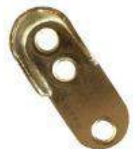
MÉNSULA P/TUBO OVALADO NIQUEL