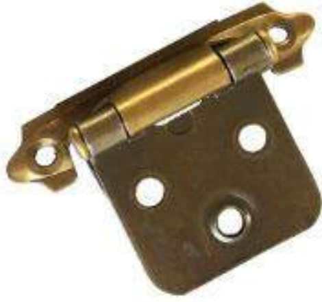
JUEGO BISAGRA T/AMERICANA