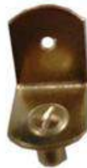
PIEZA MÉNSULA DE ENTREPAÑO