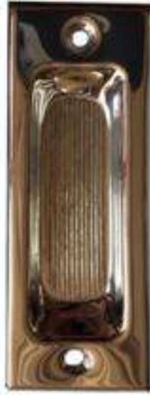
Nº 22 LÁMINA INOXIDABLE