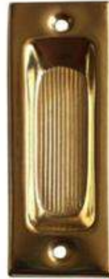
Nº 22 LATÓN PULIDO