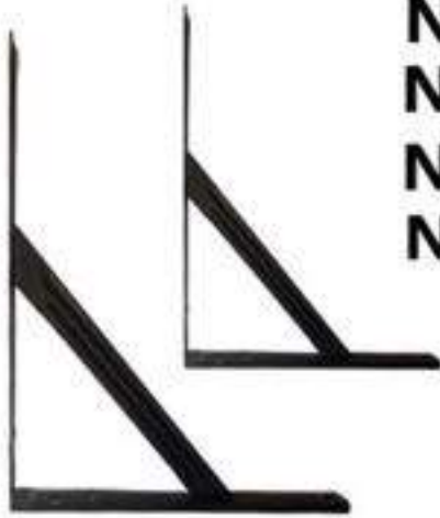
PIEZA MÉNSULA ACHAROLADA