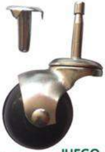
JUEGO ESPIGA 1 5/8"