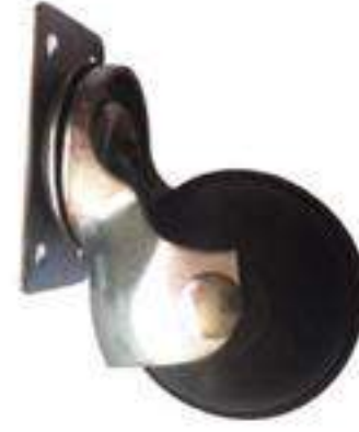
JUEGO PLACA 2"