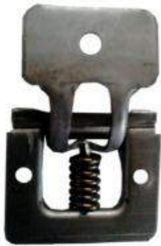
PIEZA BISAGRA P/GABINETE