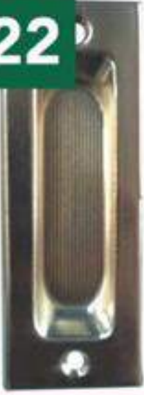
Nº 22 LÁMINA LATONADA