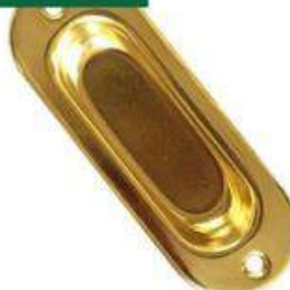
LATÓN PULIDO Y ACERO INOXIDABLE