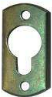
OJILLO P/CUADRO ZINC