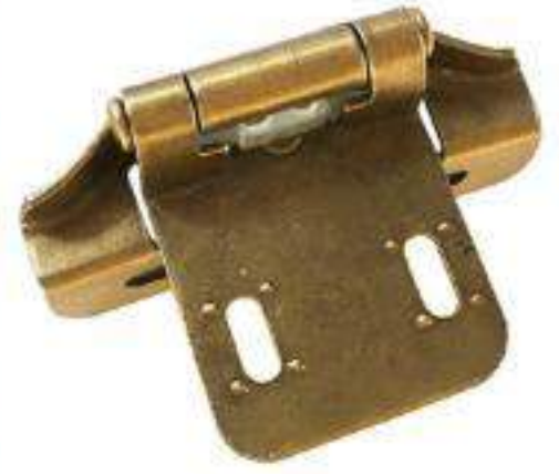
JUEGO BISAGRA TAIWANESA