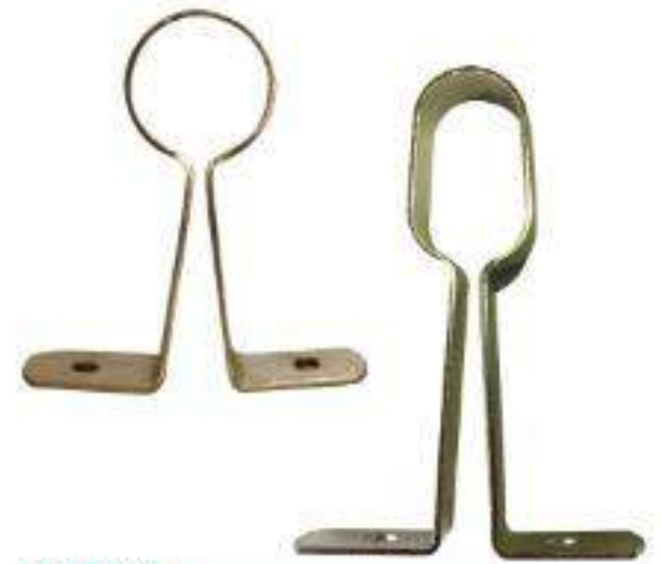
PIEZA SOPORTE UNIVERSAL Y OVAL