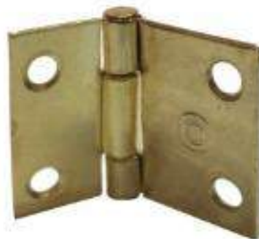
PIEZA BISAGRA COJA