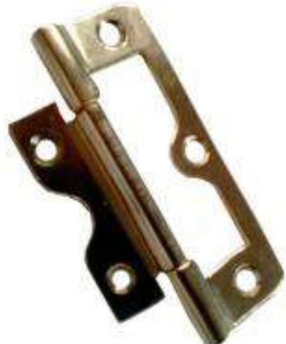
PIEZA BISAGRA T/BANDERA