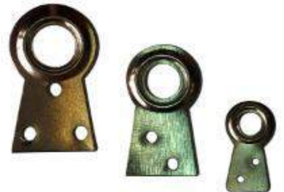
PIEZA COLA DE PATO