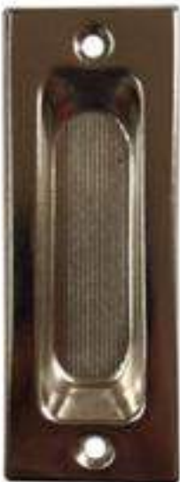
Nº 23 LÁMINA LATONADA