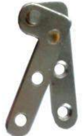
JUEGO BIBEL TIPO "L" DE 5 cm