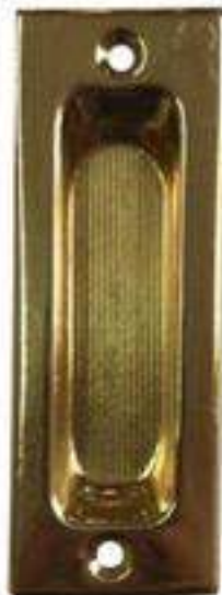
Nº 23 LATÓN PULIDO