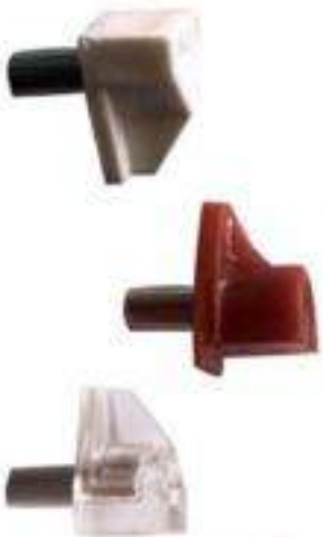
PIEZA MÉNSULA P/ENTREPAÑO