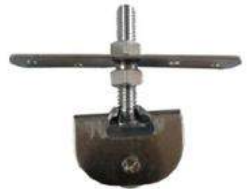
JUEGO 2 BALEROS NYLON