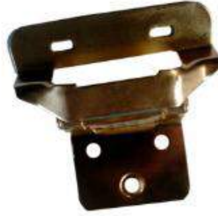
JUEGO BISAGRA T/AMERICANA