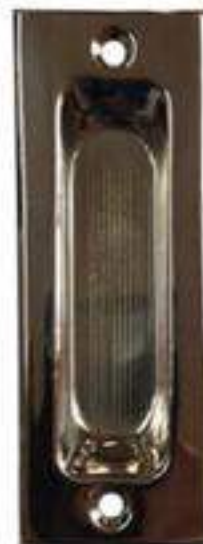
Nº 23 ACERO INOXIDABLE