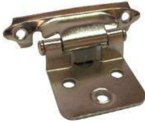
JUEGO BISAGRA T/AMERICANA